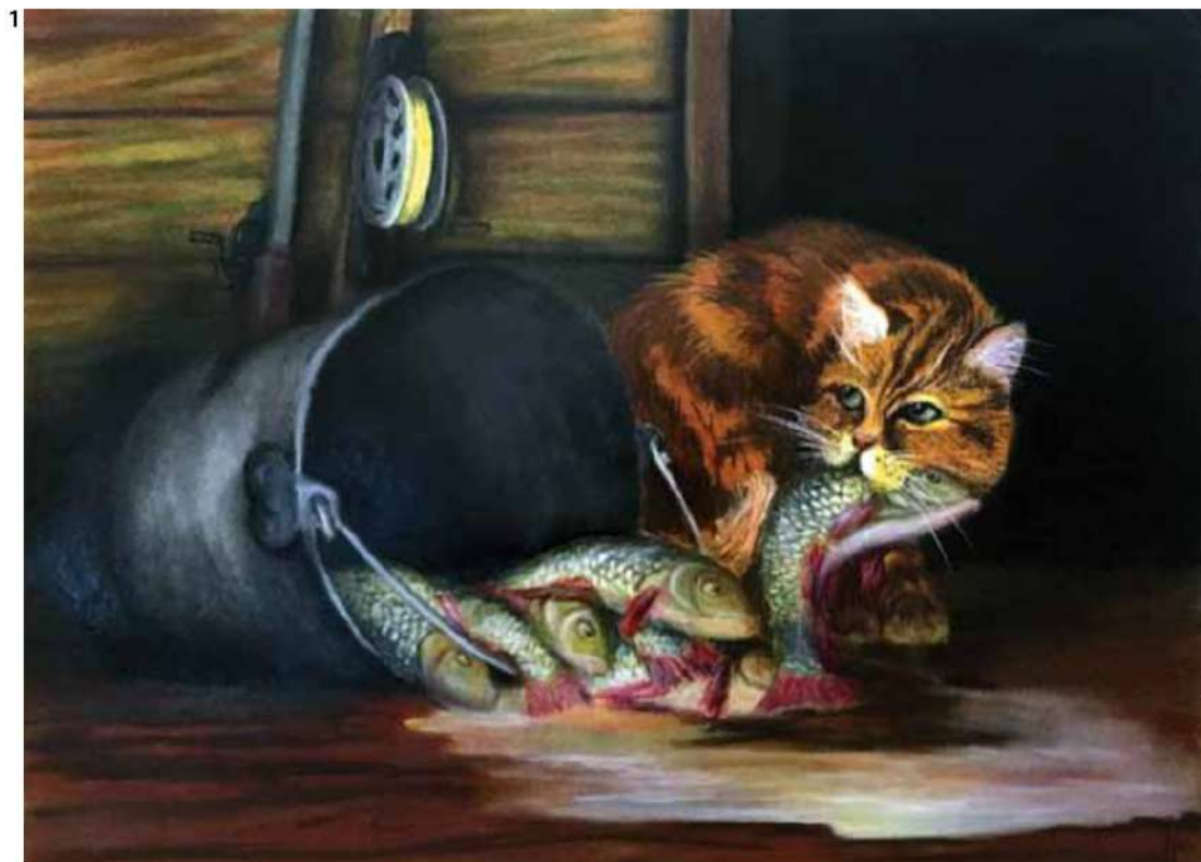
1. В. Максименко. Пошлина на улов. 2019. Б., паст. 50x65 V. Maksimenko. Fishing fee. 2019. Paper, pastel. 50x65