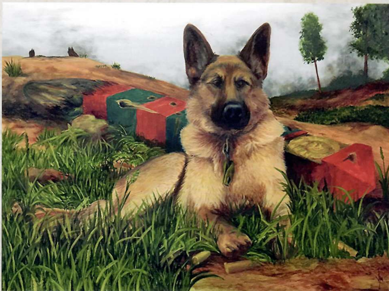
В. Максименко. Верность долгу. Последний страж границы. 2020. Х., м. 60 x 80 V. Maksimenko. Devotion to Duty. The Last Guardian of the Border. 2020. Oil on canvas. 60 x 80

22 июня 1941 года солдаты вермахта перешли Государственную границу СССР, положив тем самым начало Великой Отечественной войны. Но их планы по молниеносному продвижению вглубь нашей Родины, во время которого пограничные заставы не рассматривались в качестве серьезного препятствия, были нарушены именно этими самыми пограничниками. Заняв оборону, они дали первый бой противнику, несмотря на численное и техническое превосходство передовых частей немецкой армии. И было бы неправильно забывать о тех, кто разделял с нашими солдатами все тяготы их нелегкой службы. Судьба пограничных собак, попавших в маховик войны, доподлинно неизвестна. Да и кто о них думал в те дни, когда набирала свою силу волна человеческого горя, взяв старт с западных рубежей нашей Родины и покотившись далеко на восток. Но я более чем уверен, что четвероногие «бойцы», выжившие после бомбежек и артобстрелов, с обрывками порванных осколками поводков возвращались на свой привычный маршрут, не найдя на разрушенных врагом заставах своих товарищей по оружию. И верные долгу, не знающие таких понятий, как отступление и смена дислокации, продолжали патрулировать Государственную границу СССР.