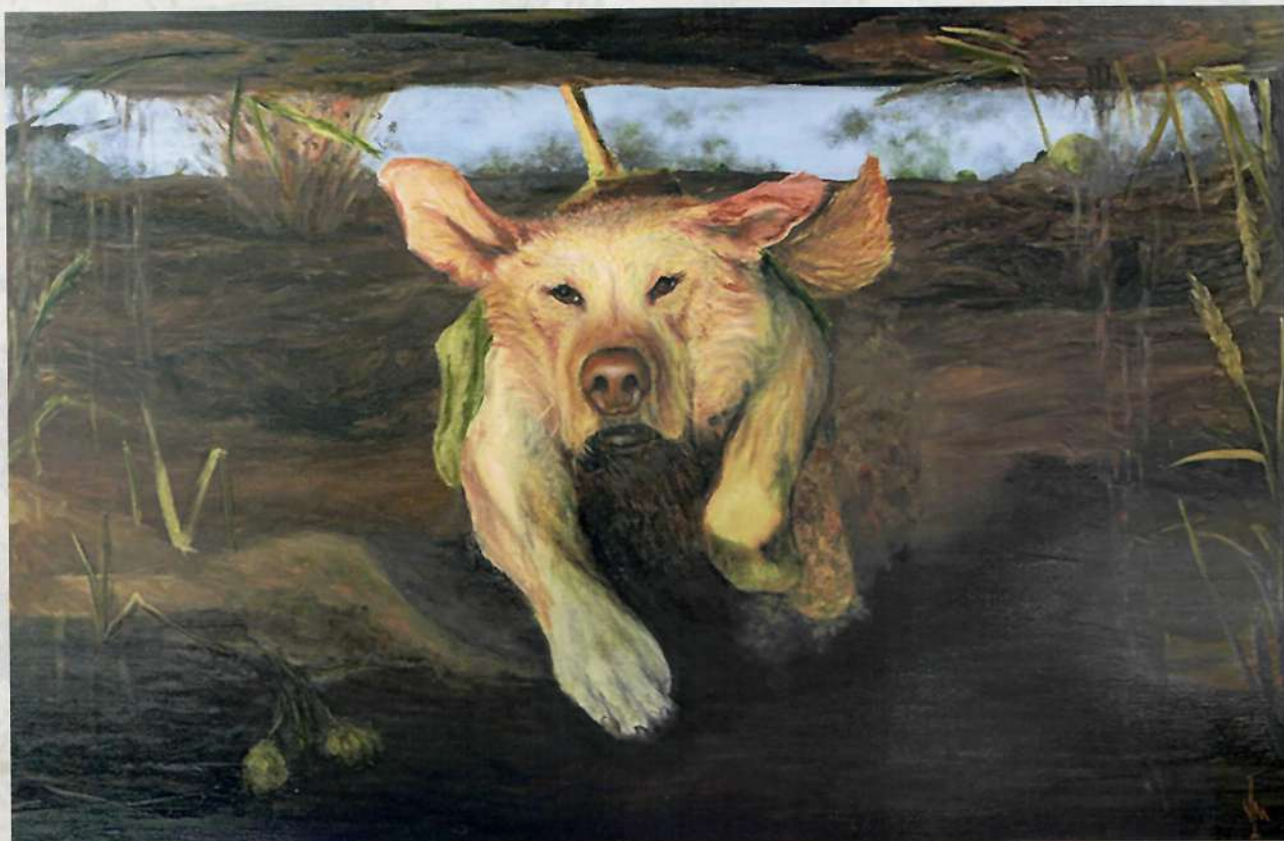
В. Максименко. Обреченная на смерть. 2019. Х., м. 60 x 90 V. Maksimenko. Doomed to Death. 2019. Oil on canvas. 60 x 90

Картина посвящена роли собак в Великой Отечественной войне. В 1935 году в РККА были приняты на вооружение собаки – истребители танков, дислоцированные на территории специальной воинской части в Подмоскowie. Основная задача состояла в физическом уничтожении танковых подразделений противника. Вначале на собаку надевали специальные под сумки со взрывчаткой и детонатором, расположенным на спине, после выдергивали предохранитель из детонатора запускали животное в сторону немецких танков. Собаку-истребителя дрессировали, чтобы она, избегая огня противника, бегом приближалась к танку и ныряла под его днище. При этом деревянный штырь на детонаторе упирался в танк и активировал взрывчатое вещество, уничтожая и танк и собаку-смертника. Чтобы собаки не разбегались, их во время дрессировки держали впроголодь и кормили из-под танка, приучая забегать под машину, не боясь ее. Всего за время войны было уничтожено 300 танков, то есть 300 собак положили свои жизни на алтарь Победы (не считая погибших на подходе к танкам от немецких пулеметов и огнеметов).